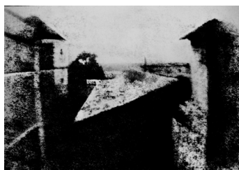
Vista desde la ventana en Le Gras. Esta fue la primera fotografía permanente, tomada en 1826 por Niépce.