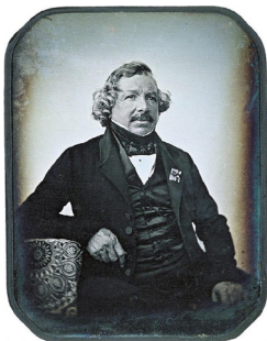
Retrato de Louis Daguerre (1787-1851) tomado por el fotógrafo Jean-Baptiste Sabatier-Blot (1801-1881).

Este procedimiento fotográfico antiguo fue perfeccionado por el francés Louis-Jacques-Mandé Daguerre , más conocido como Louis Daguerre, a partir de las investigaciones y experiencias fotográficas previas, descubiertas por Joseph Nicéphore Niépce.