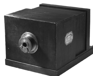
Este es el diseño de la primera cámara fotográfica utilizada para obtener daguerrotipos.