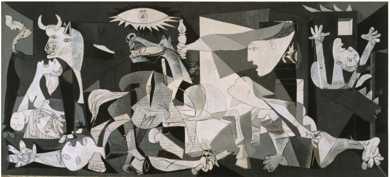
Pablo Picasso Guernica Óleo sobre lienzo 349,3 x 776,6 cm 1937 Colección Museo Reina Sofía, España