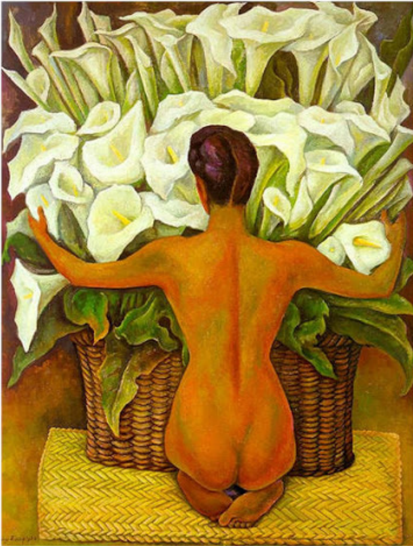
Diego Rivera Desnudo con alcatraces Oleo 78,74 x 60 cm. 1944