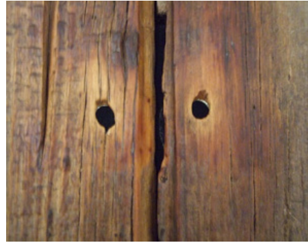
Marcel Duchamp Étant Donnés: 1° La chute d'eau 2° Le gaz d'éclairage 1966