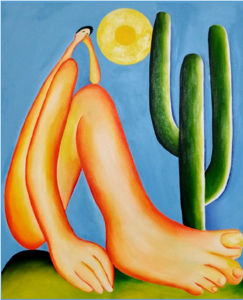
Tarsila do Amaral Abaporu Óleo sobre lienzo 73 cm × 85 cm 1928