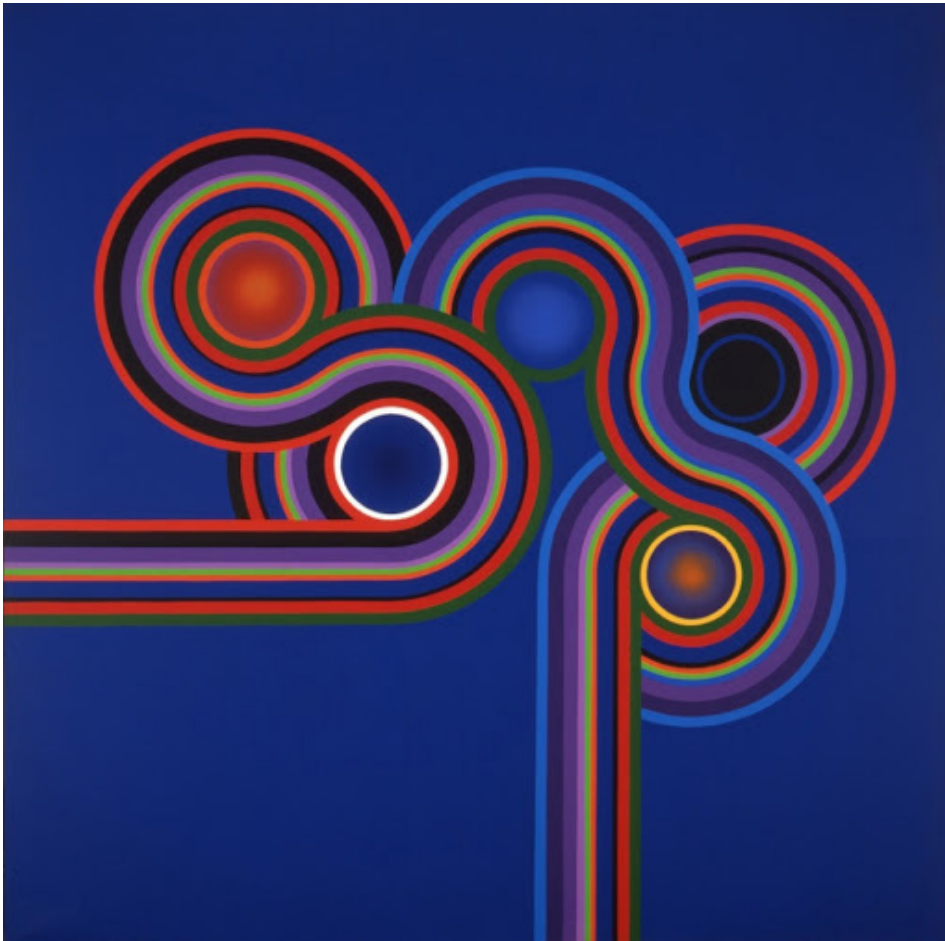
Kazuya Sakai Turangalila I 1976 Acrílico sobre tela 200 x 200 cm Museo Tamayo (México)