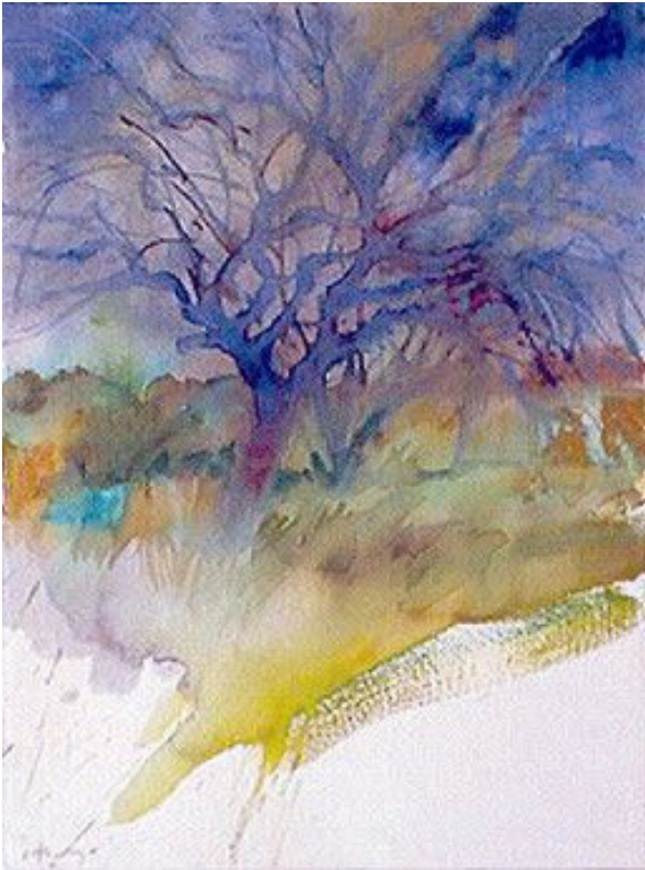
Carlos Alonso De la serie Romance del Río Seco Acuarela