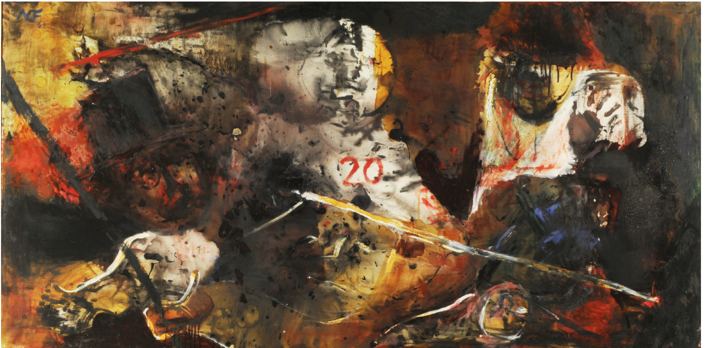
Luis Felipe Noé La Anarquía del año XX 1963 Oleo sobre tela Museo Nacional de Bellas Artes