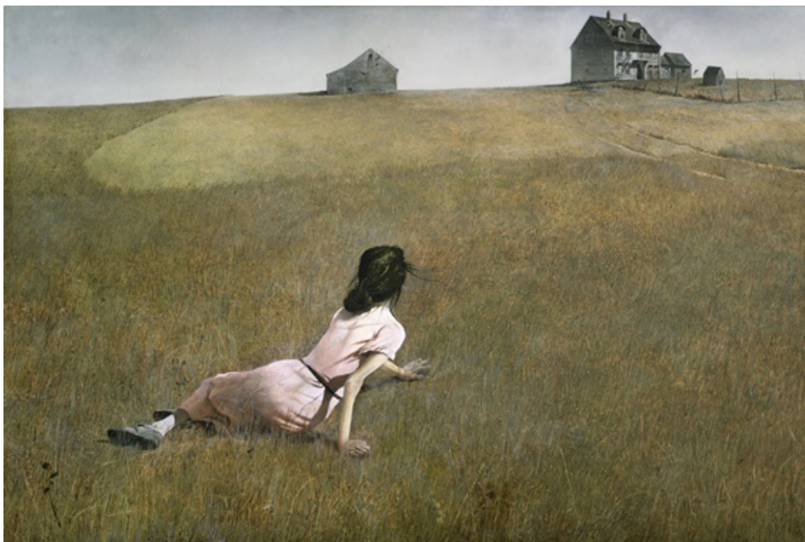
Wyeth, Andrew El mundo de Cristina Temple sobre lienzo 30,6 x 45,9 cm 1948 Colección permanente Museo de Arte Moderno (MoMA), Nueva York.