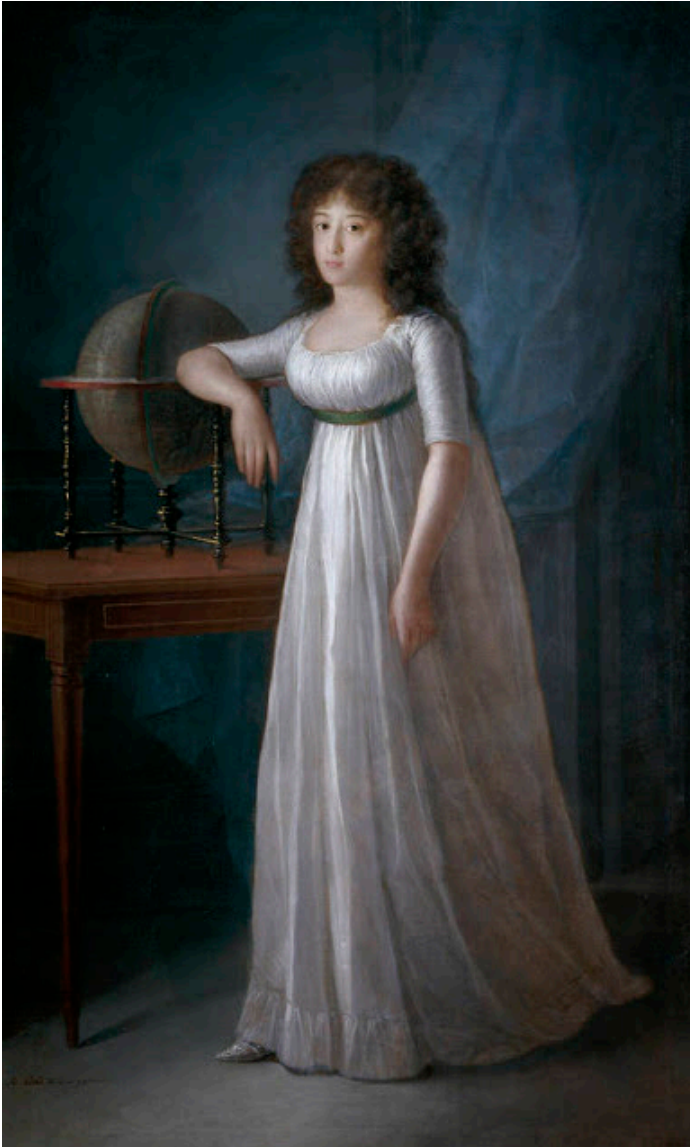
Esteve y Marqués, Agustín Joaquina Téllez-Girón, hija de los IX duques de Osuna 1798 Óleo sobre lienzo 190 cm. x 16 cm. Museo del Prado