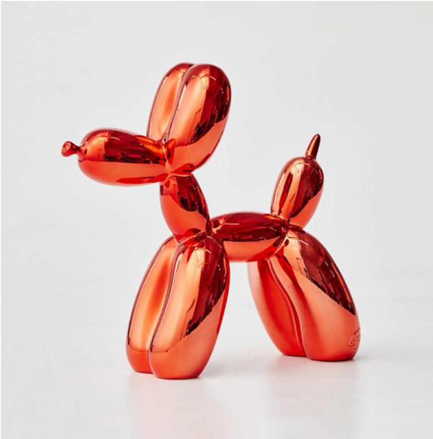
Jeff Koons Balloon Dog (orange) acero inoxidable 1994-2000 307.3 x 363.2 x 114.3 cm