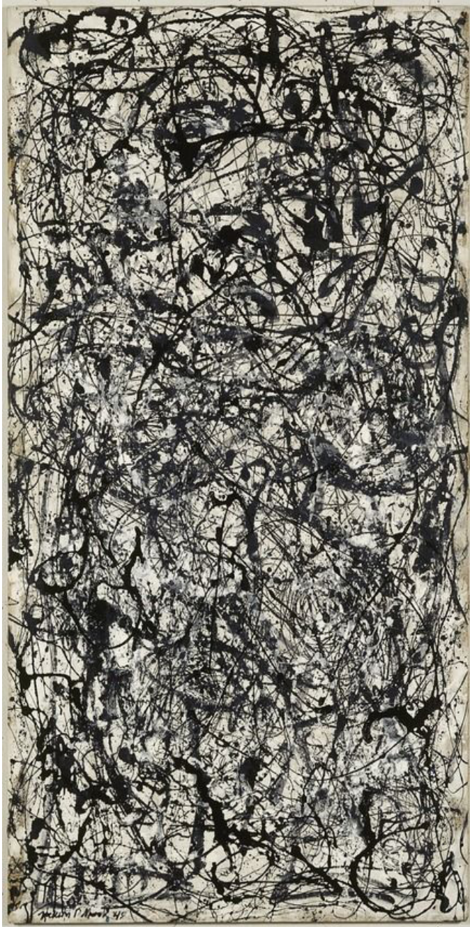
Jackson Pollock Número 26 A, Negro y Blanco Pintura sobre lienzo 205 x 121,7 cm 1948 Centro Pompidou