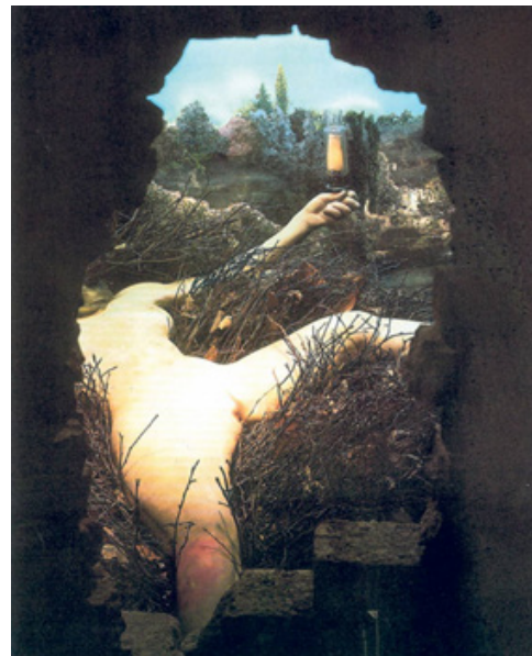
"Étant donné" ("La cascade") es un cuadro visible a través de un par de mirillas (una para cada ojo) en una puerta de madera. Museo de Arte Moderno de Filadelfia.