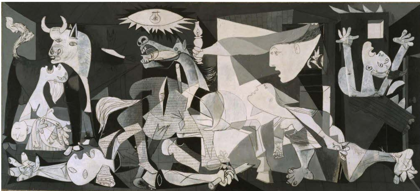
Pablo Picasso Guernica Óleo sobre lienzo 349,3 x 776,6 cm 1937 Colección Museo Reina Sofía, España