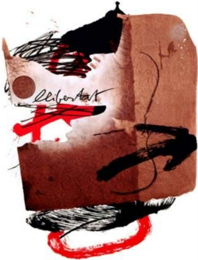
Antoni Tàpies "Llibertat" 1988