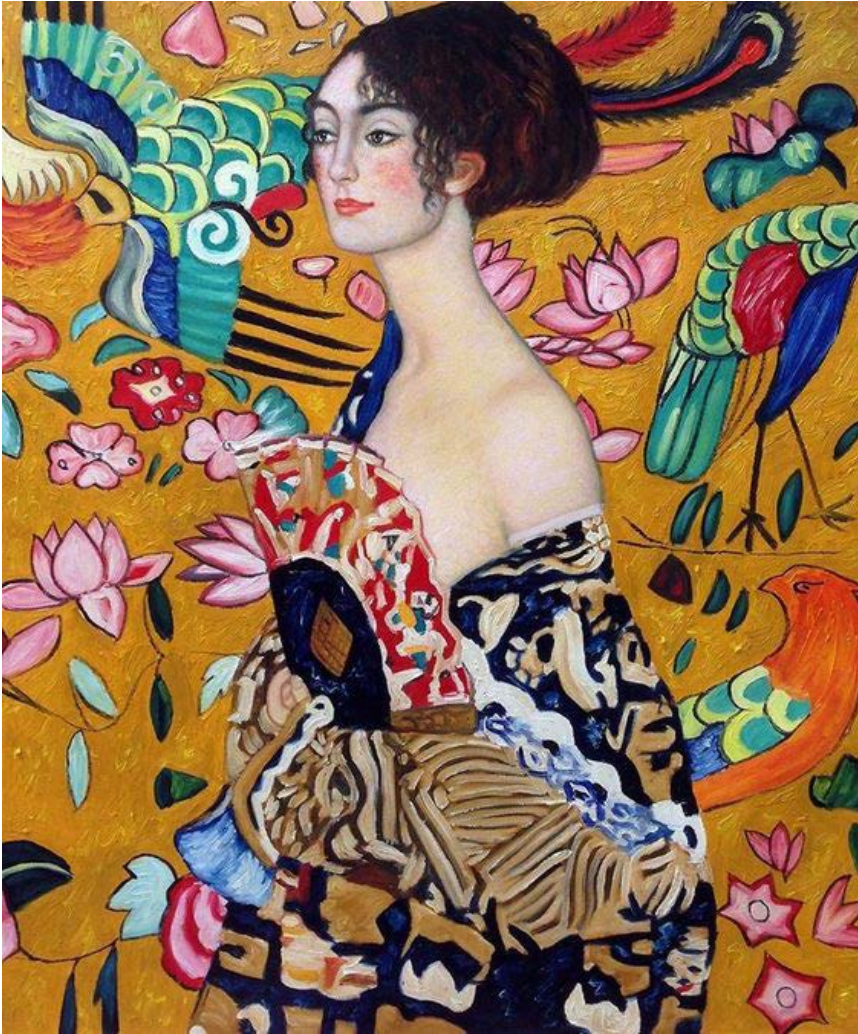
Gustav Klimt Dama con abanico 1909