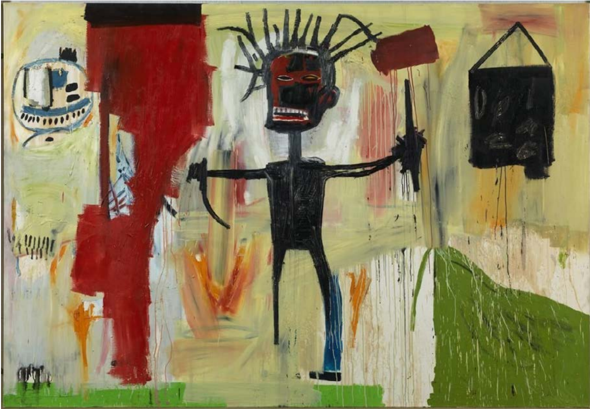
Jean Michel Basquiat "Autoretrato" 1986 Colección MACBA