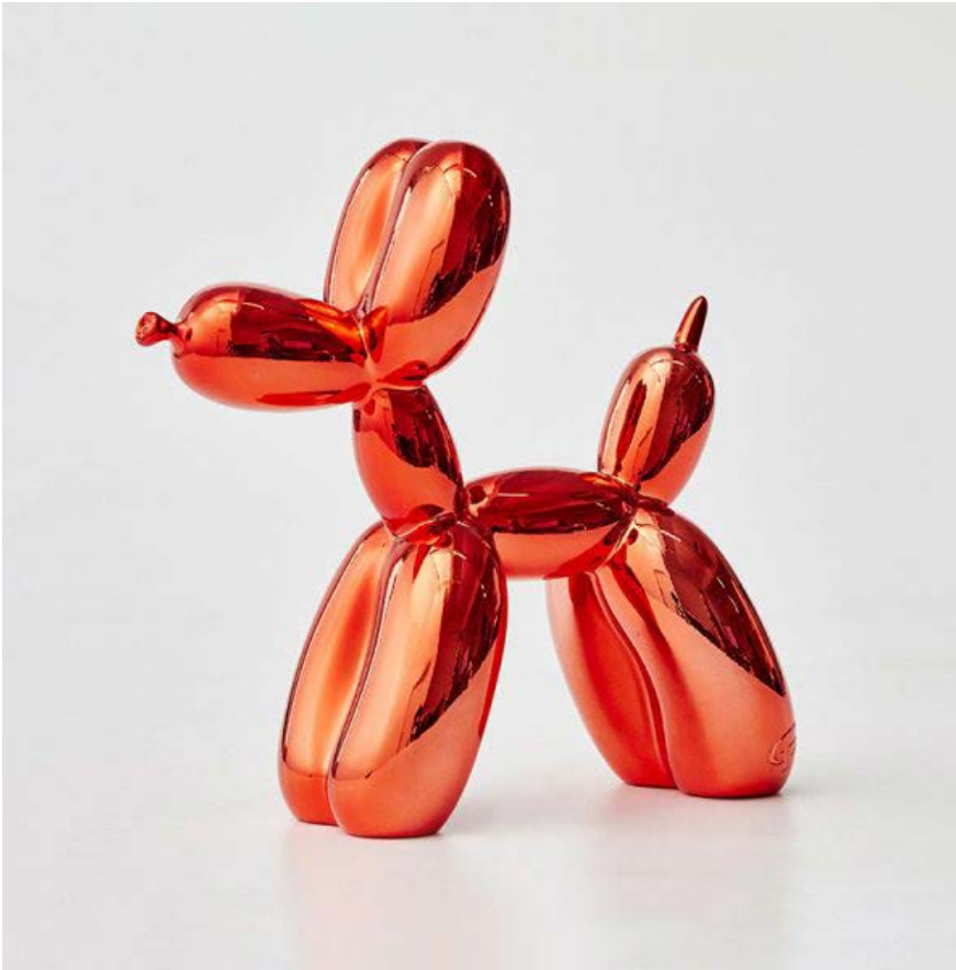
Jeff Koons Balloon Dog (orange) acero inoxidable 1994-2000 307.3 x 363.2 x 114.3 cm