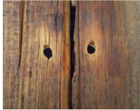
Marcel Duchamp Étant Donnés: 1° La chute d'eau 2° Le gaz d'éclairage 1966