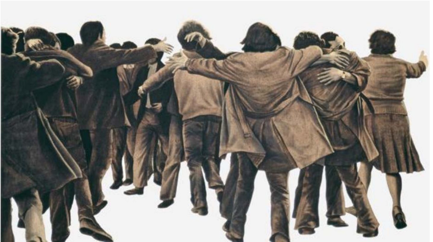
Juan Genovès El Abrazo