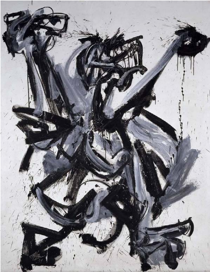
Antonio Saura El Grito