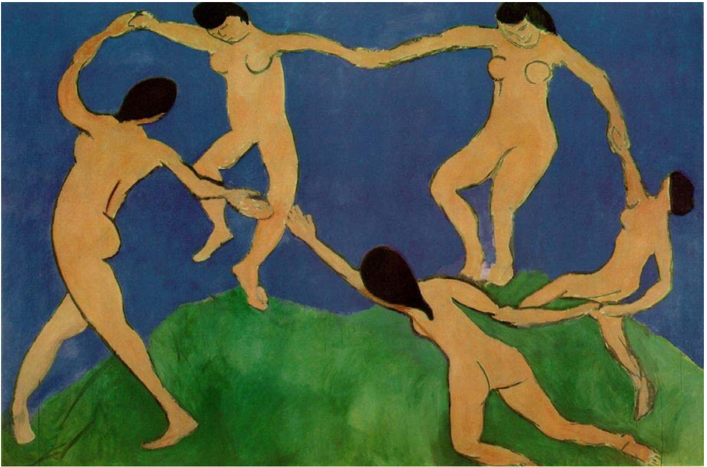
Henri Matisse La danza 1909