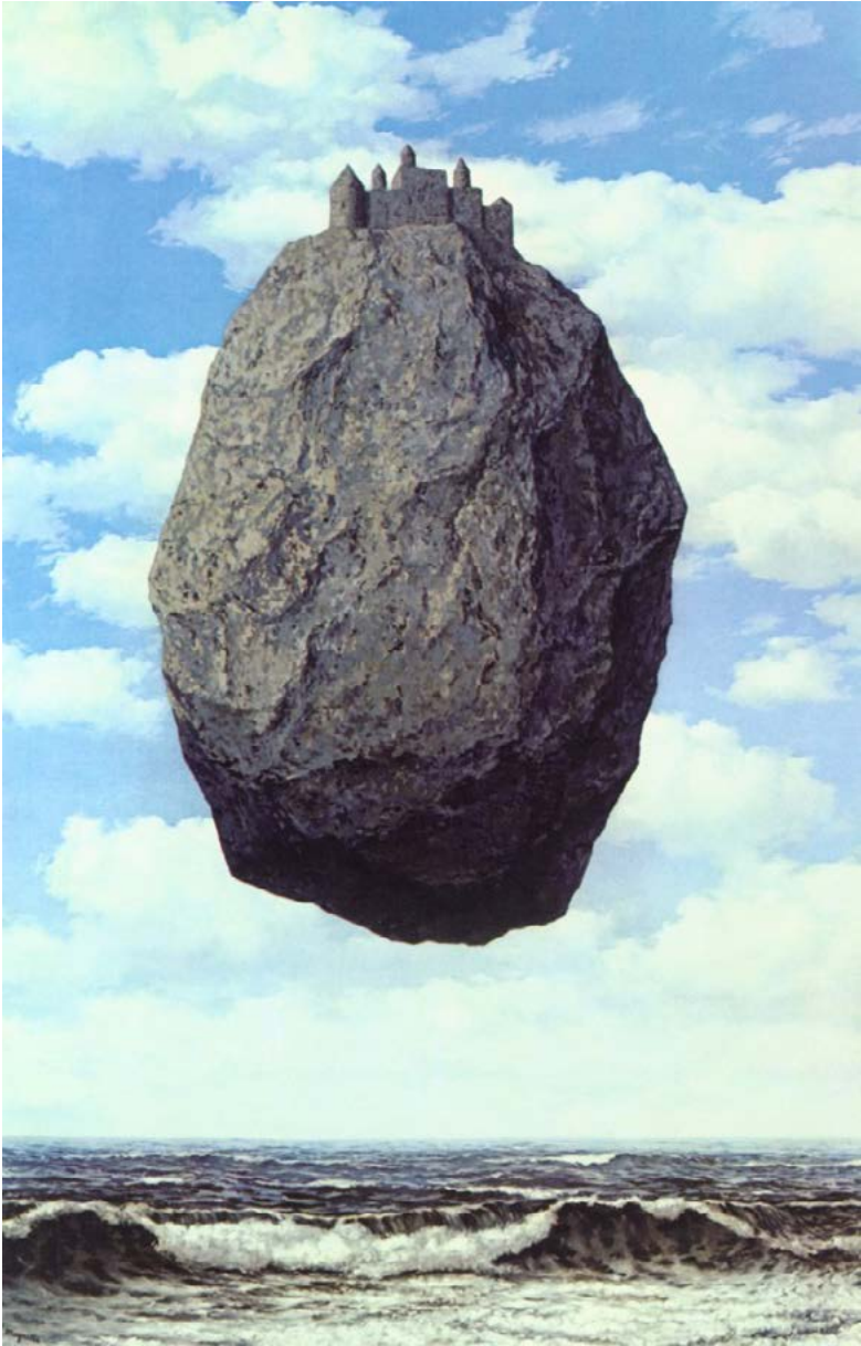
Renè Magritte "El Castillo de los Pirineos" 1959