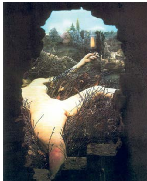
"Étant donnés" ("La cascade") es un cuadro visible a través de un par de mirillas (una para cada ojo) en una puerta de madera. Museo de Arte Moderno de Filadelfia.