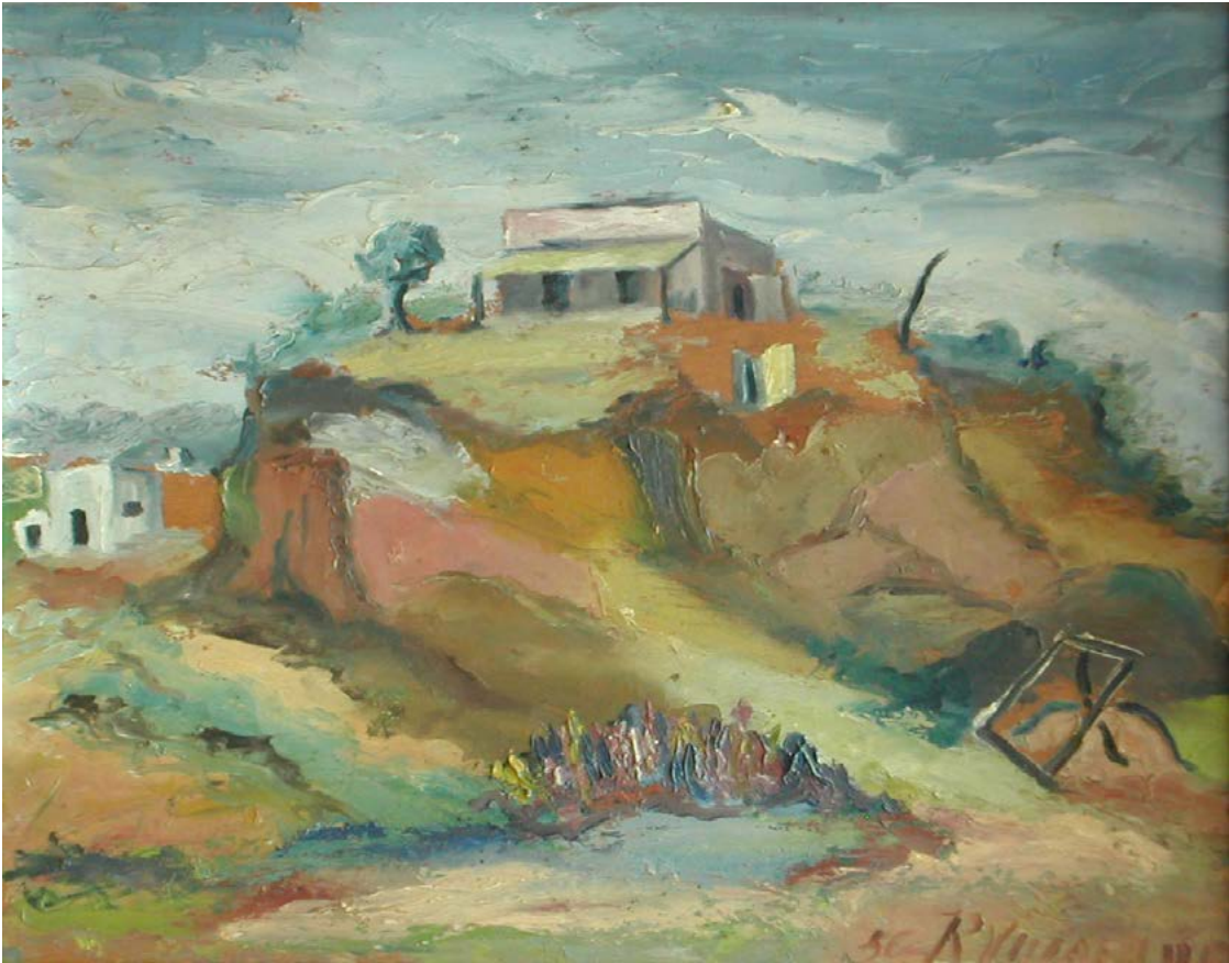
Ramon Villaña La casa del alto