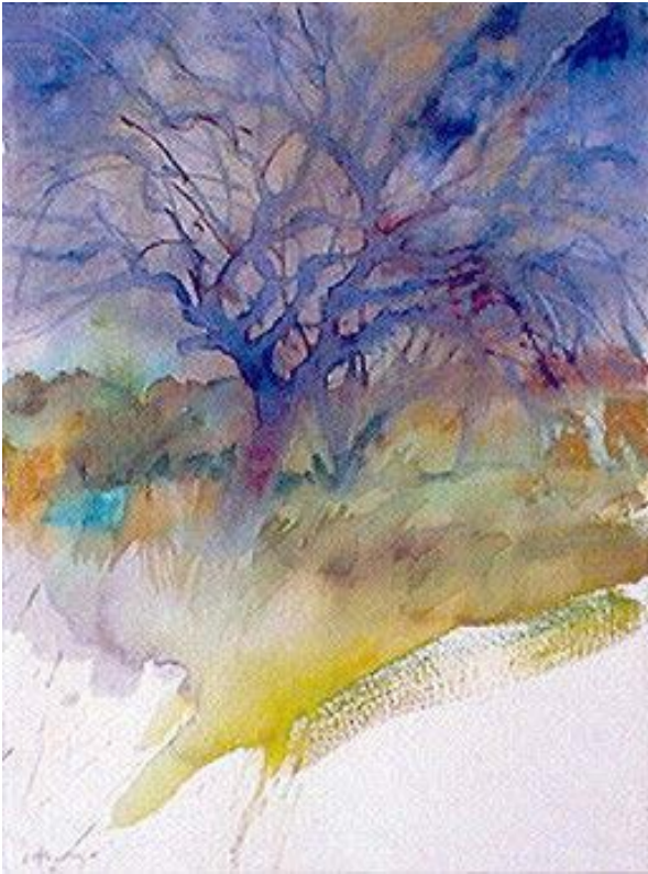
Carlos Alonso De la serie Romance del Río Seco Acuarela