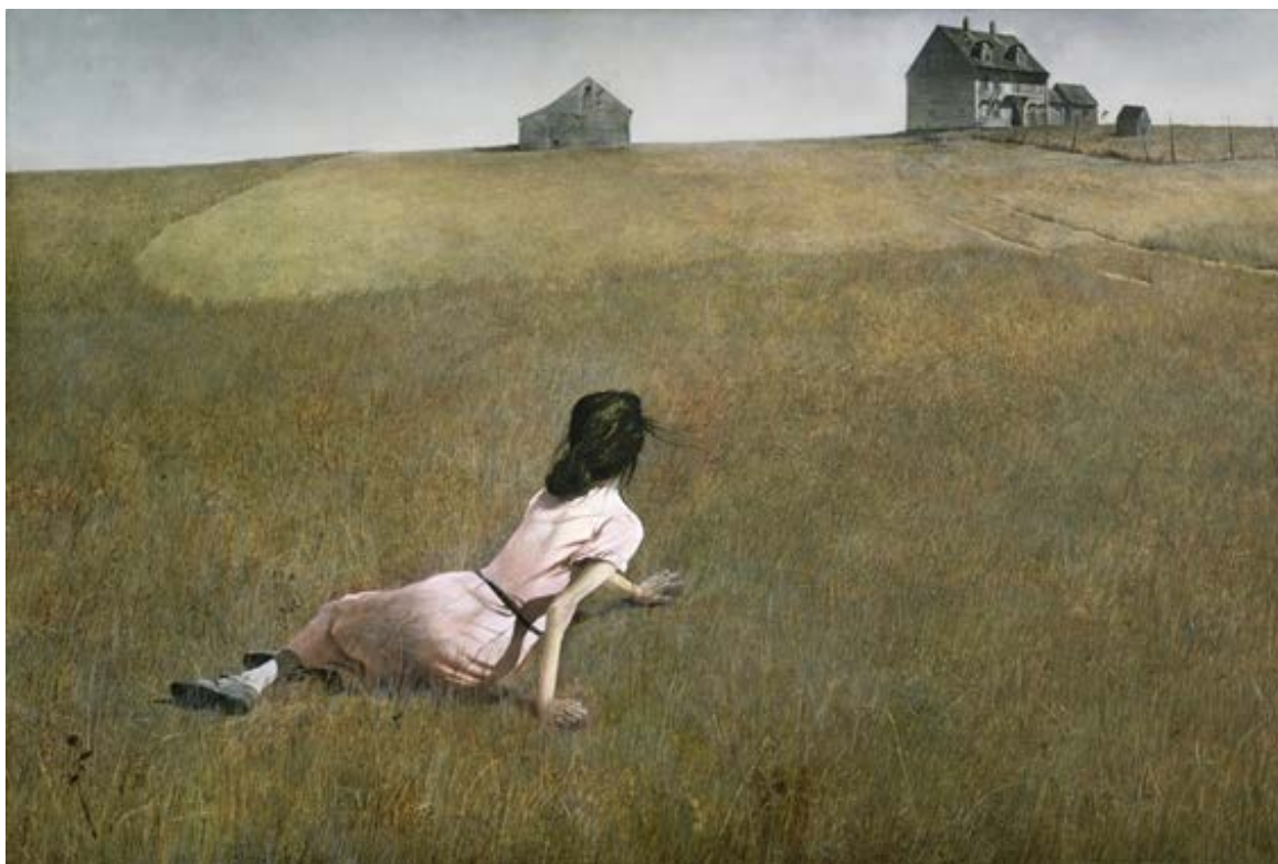
Wyeth, Andrew El mundo de Cristina Temple sobre lienzo 30,6 x 45,9 cm 1948 Colección permanente Museo de Arte Moderno (MoMA), Nueva York.