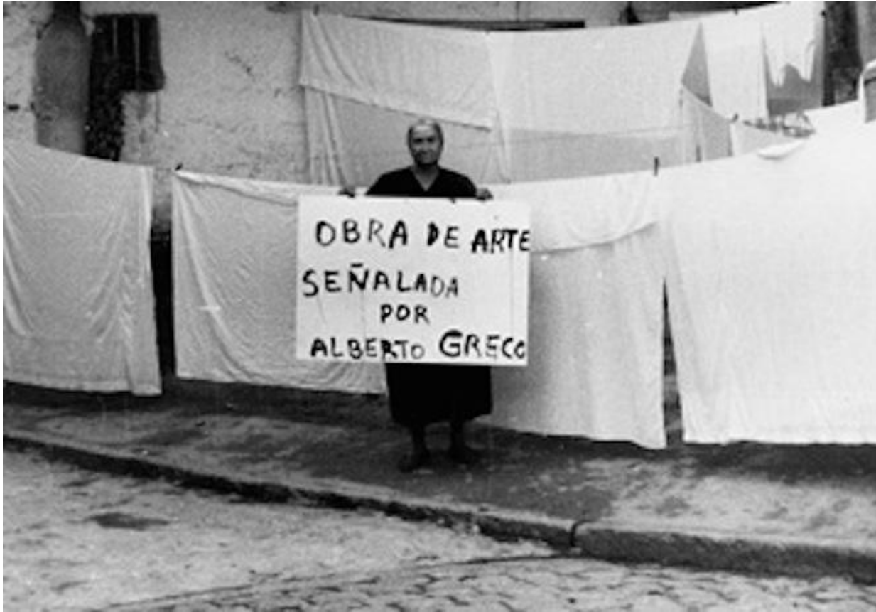
Alberto Greco "Vivo Dito" 1962