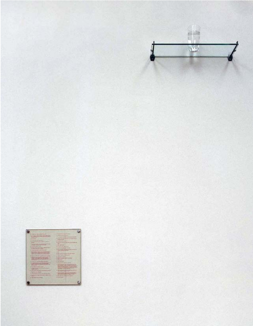
Michael Craig Martin An Oak Tree (Un Roble) 1973