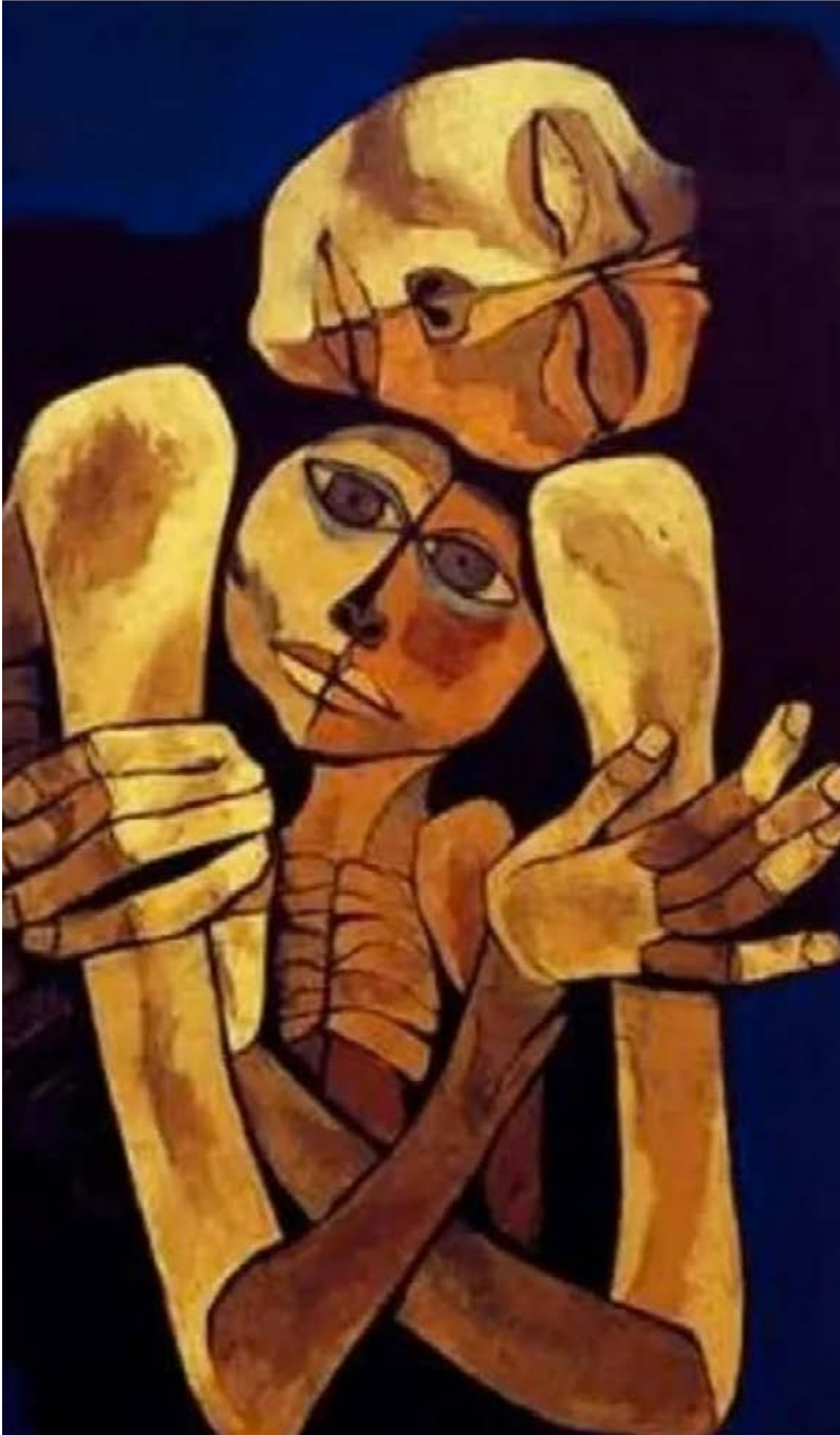
Oswaldo Guayasamin "La Ternura" 1989