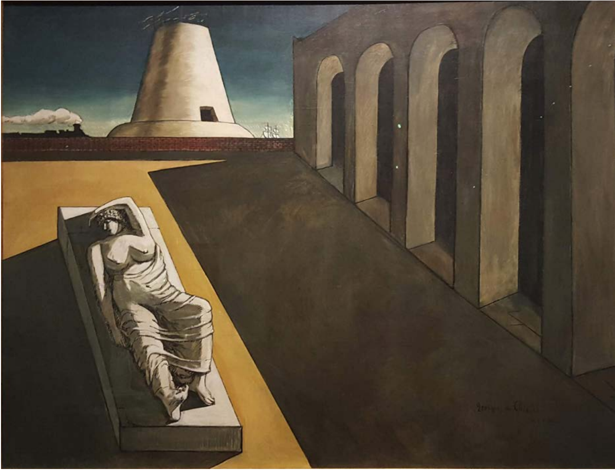
Giorgio de Chirico Ariadne 1913