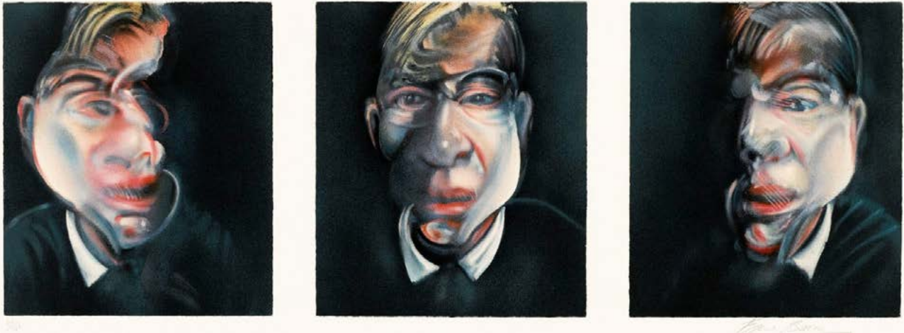
Francis Bacon Tres estudios para autorretrato Oleo sobre lienzo 35,5 x 30,5 cm (cada uno) 1975