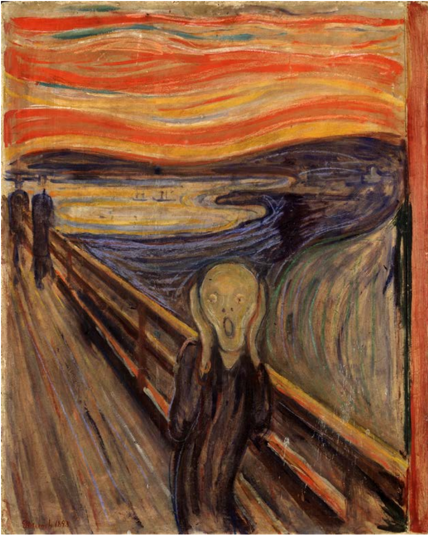
Edvard Munch "El Grito" 1893