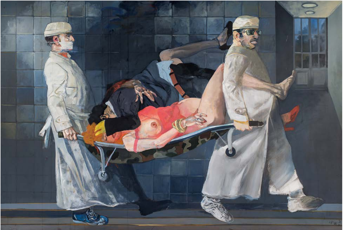
Carlos Alonso Mal de amores 2 1986