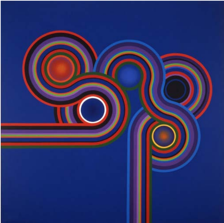
Kazuya Sakai Turangalila I 1976 Acrílico sobre tela 200 x 200 cm Museo Tamayo (México)