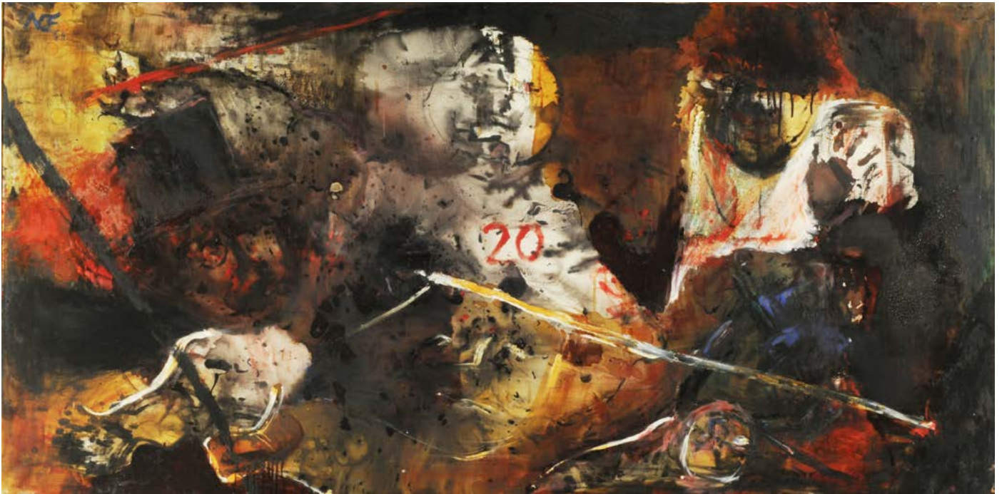
Luis Felipe Noé La Anarquía del año XX 1963 Oleo sobre tela Museo Nacional de Bellas Artes