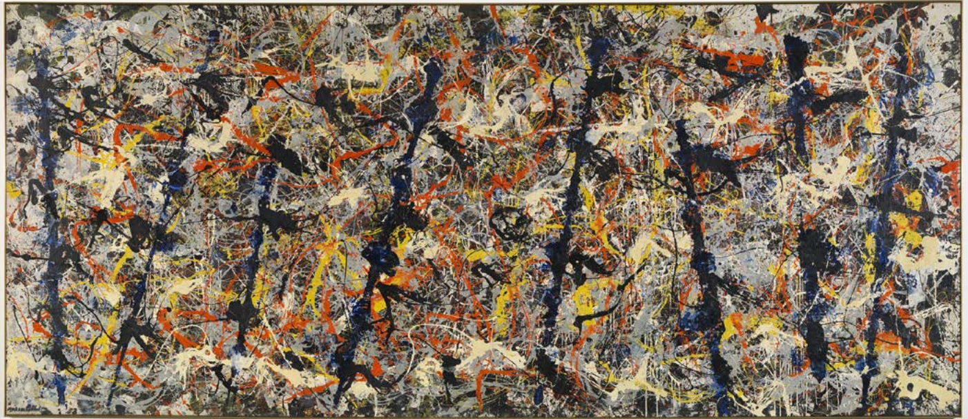
Jackson Pollock Los postes azules n° 11 1952 óleo, esmalte y pintura de aluminio con fragmentos de cristal sobre lienzo 213 x 489 cm National Gallery of Australia, Camberra , Australia