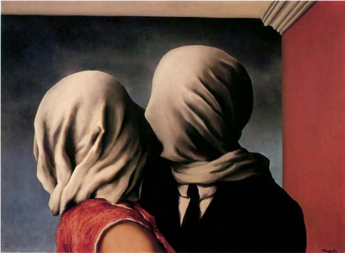
Rene Magritte Los amantes 1928