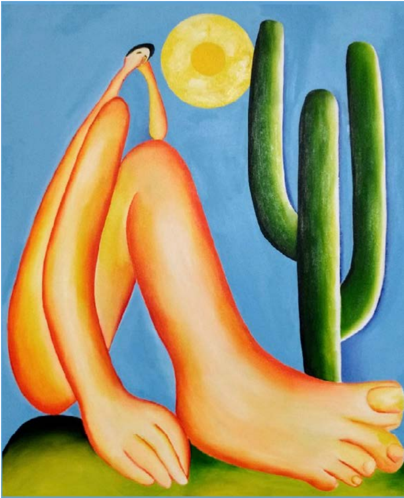
Tarsila do Amaral Abaporu Óleo sobre lienzo 73 cm × 85 cm 1928