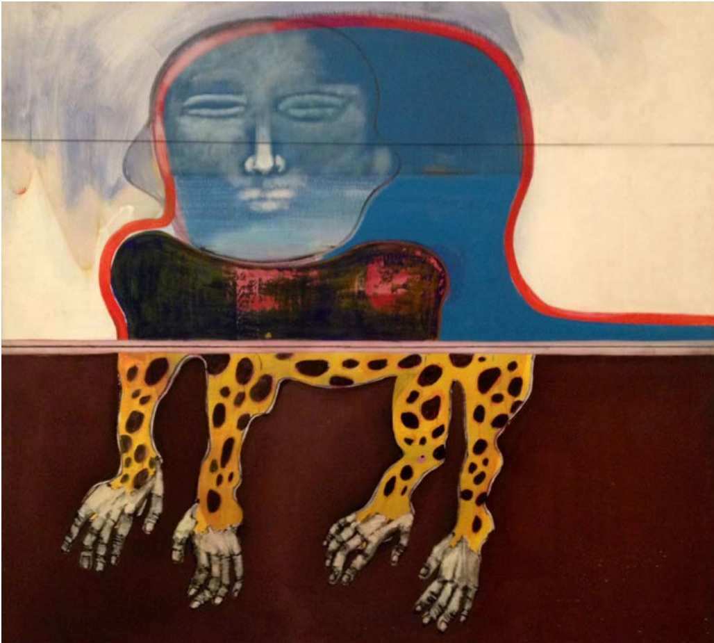
Romulo Maccio Adentro y afuera 1967