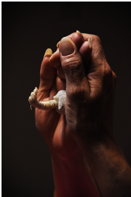
Las manos. Fotografía digital. Papel obra 120 gr retocado con pintura acrílica y tinta china. 2017.