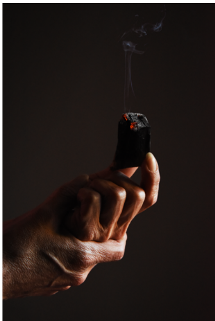
Las manos. Fotografía digital. Papel obra 120 gr retocado con pintura acrílica y tinta china. 2017.

14 DE DICIEMBRE 2019 AL 22 DE MARZO 2020