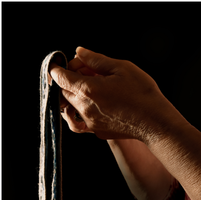
Generaciones. Fotografía digital. Papel obra 120 gr retocado con pintura acrílica y tinta china. 2019.