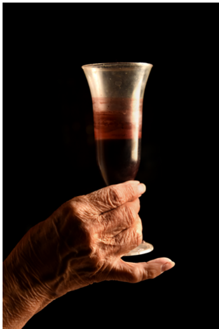
Ofrenda de la nona. Fotografía digital. Papel obra 120 gr retocado con pintura acrílica y tinta china. 2018