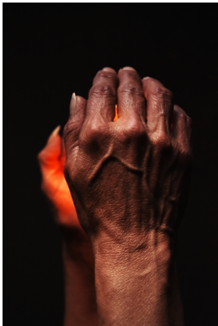
Las manos. Fotografía digital. Papel obra 120 gr retocado con pintura acrílica y tinta china. 2017.