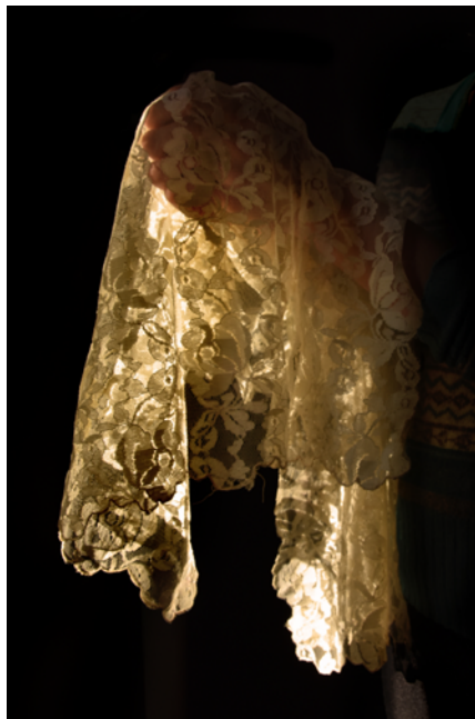
El manto de Vanina. Fotografía digital. Papel obra 120 gr retocado con pintura acrílica y tinta china. 2018.