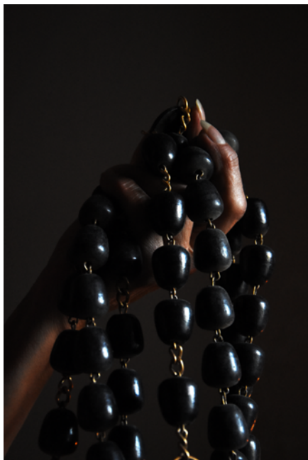
Las manos. Fotografía digital. Papel obra 120 gr retocado con pintura acrílica y tinta china. 2017.

14 DE DICIEMBRE 2019 AL 22 DE MARZO 2020