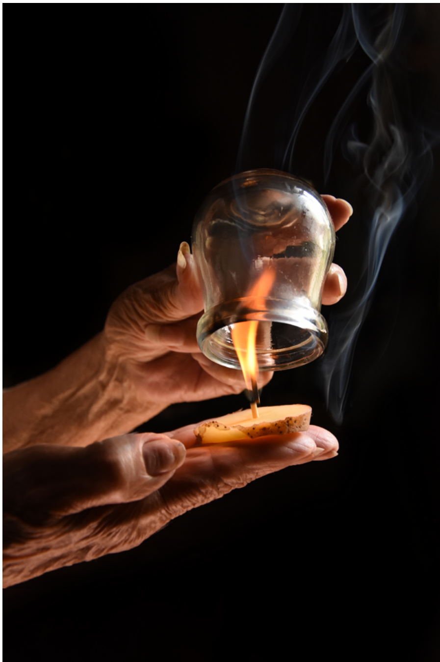
Ventosa de la nona. Fotografía digital. Papel obra 120 gr retocado con pintura acrílica y tinta china. 2018.

14 DE DICIEMBRE 2019 AL 22 DE MARZO 2020